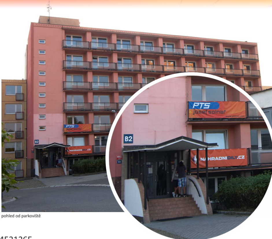
pohled od parkoviště